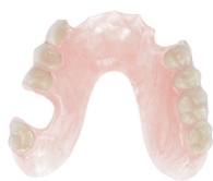
Billede 2: Transperant Pink (TTRV)

Takket være den store translucens er Vertex™ ThermoSens meget mindre iøjefaldende end det traditionelle protesestel i mindre gennemsigtigt akryl. Med de fem disponible farver: Transperant Pink (TTRV, billede 2), Orange Pink (TS, billede 3), Standard pink (T05, billede 4), Rødlig Pink (T10, billede 5) og Mørk Pink (T18, billede 6) er der en farve, der passer til de fleste patienter, og som tilpasser sig rigtig godt også i fronten. Derfor kan Vertex™ ThermoSens-materialet også bruges som gingivafarvet