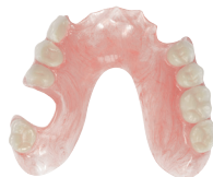
Billede 3: Orange Pink (TS)