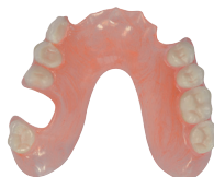
Billede 5: Rødlig Pink (T10)